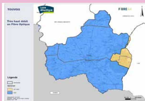
Le calendrier du très haut débit sur Touvois

2017- 2023 : 7 locaux prochainement raccordables à l'est de la commune dans le cadre d'une première phase de travaux.